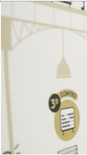
| BOGOTÁ |