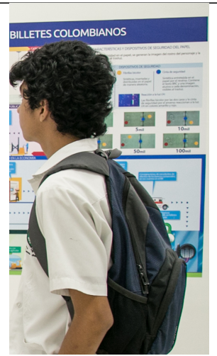
| SANTA MARTA |