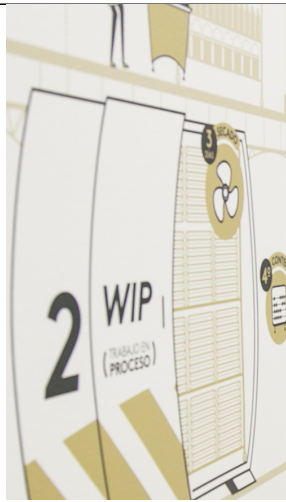
| CALI |