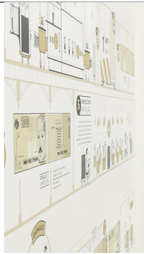
| MEDELLÍN |